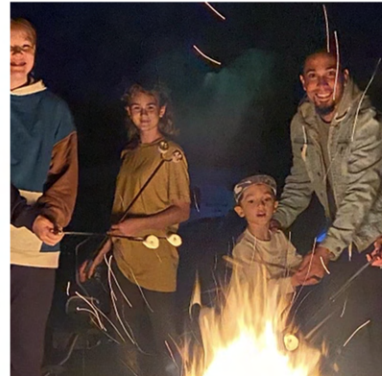
AMIGOS JUNTO AL FUEGO EN SUCOT