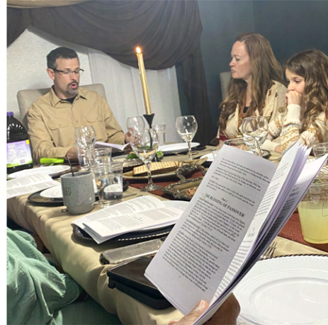
CENA DE PESAJ