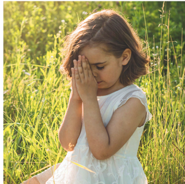
ORACIÓN DE EXPIACIÓN