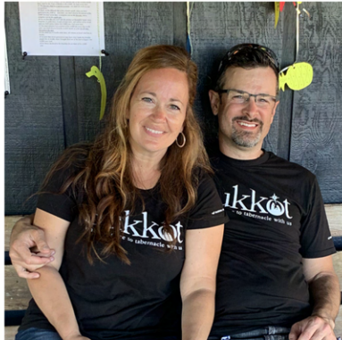
TIEMPO FAMILIAR EN SUCOT

Como todos los días festivos dados a Su pueblo, cada uno nos recuerda que Él es el único que sostiene, Él es el único que preserva, Él es el único que redime. Es hora de que entremos en la plenitud de la alianza y participemos de todo corazón en estas siete fiestas. Al hacerlo, nuestras vidas no sólo se enriquecerán con la plenitud de lo que Él ha hecho y hará, ¡sino que seremos un mayor testimonio para todos aquellos que buscan la verdad!