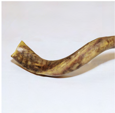
UN SHOFAR, TÍPICAMENTE TOCADO EN TROMPETAS