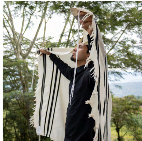
PODEROSA ADORACIÓN DURANTE PENTECOSTÉS