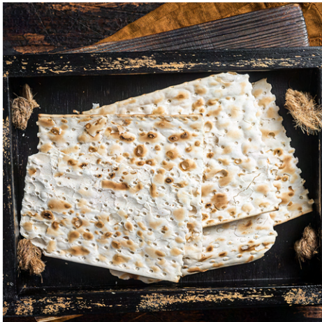
PAN SIN LEVADURA